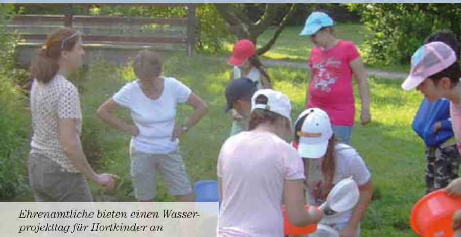
Ehrenamtliche bieten einen Wasserprojekttag für Hortkinder an

Nein. Einmal ist ein Mann auf eigenen Wunsch ausgeschieden, der ganz wunderbar mit den Kindern geschreiner